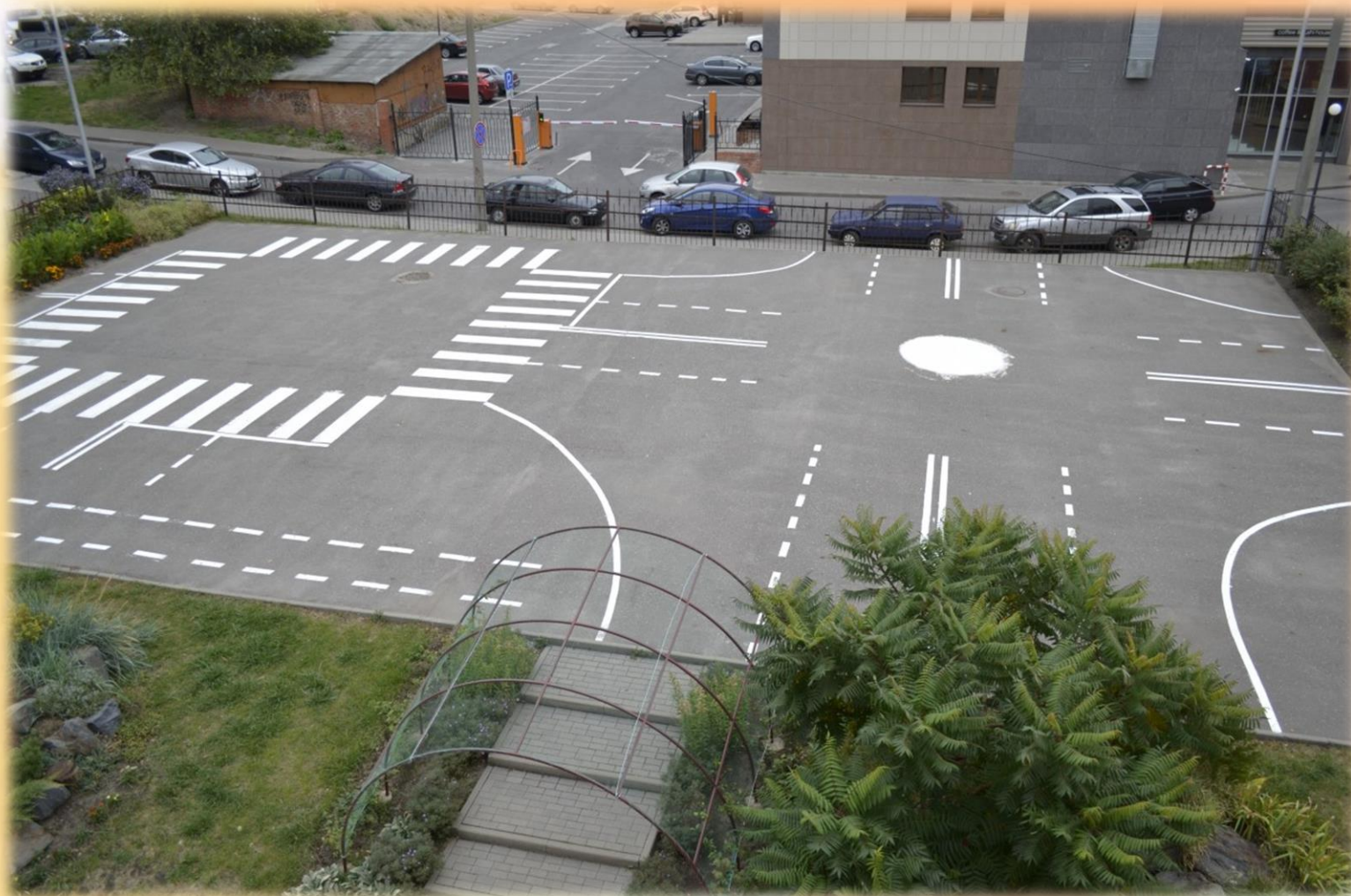
Школьная транспортная площадка