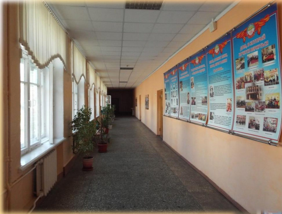
Коридор 2-го этажа