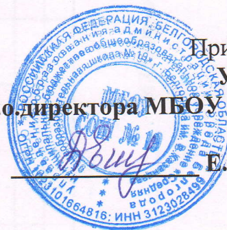
ГРАФИК ПИТАНИЯ В ШКОЛЬНОЙ СТОЛОВОЙ НА ПЕРВОЕ ПОЛУГОДИЕ 2023-2024 УЧЕБНЫЙ ГОД